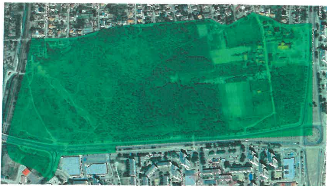
Ortofotomapa obszaru objętego uchwałą o przystąpieniu do sporządzenia planu miejscowego ( https://mapy.legnica.eu )

Obszar objęty opracowaniem planistycznym zajmuje powierzchnię 36,19 ha i położony jest we wschodniej części Legnicy, na osiedlu Piekary, w sąsiedztwie ulic: Jaskółczej, Kraka, W. Sikorskiego i Al. Marszałka Józefa Piłsudskiego. Jest to teren w znacznej mierze niezainwestowany. Zlokalizowane są na nim obiekty usługowe np. kościół oraz budynki mieszkaniowe.