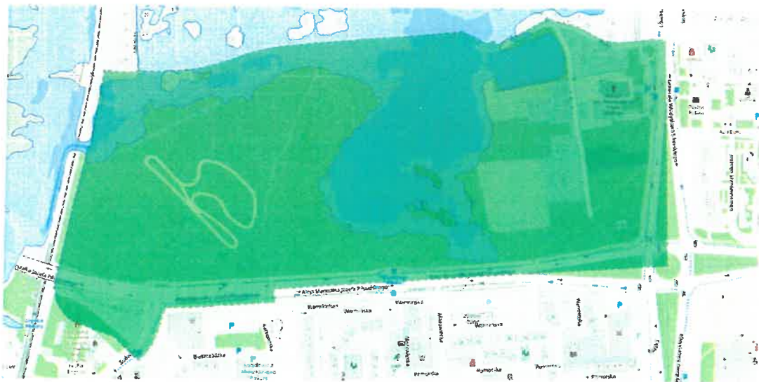
Zagrożenie powodziowe na obszarze objętym przystąpieniem do opracowania planu miejscowego ( https://mapy.legnica.eu )

Część terenu objętego przystąpieniem do sporządzenia planu miejscowego położona jest na obszarze szczególnego zagrożenia powodzią, na którym prawdopodobieństwo wystąpienia powodzi jest średnie i wynosi 1%. Zagospodarowanie tej części terenu odbędzie się zgodnie z wytycznymi Regionalnego Zarządu Gospodarki Wodnej we Wrocławiu.