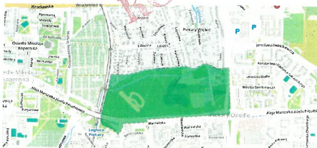
Lokalizacja obszaru objętego przystąpieniem do opracowania planu miejscowego ( https://mapy.legnica.eu )