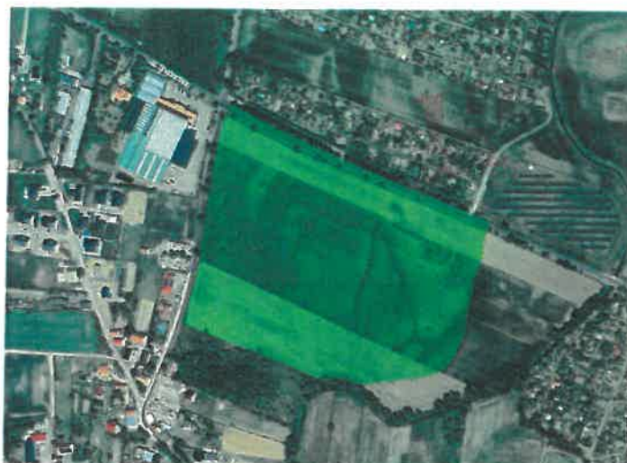
Ortofotomapa obszaru objętego przystąpieniem do opracowania planu miejscowego ( https://mapy.legnica.eu )

Na omawianym terenie znajdują się przede wszystkim grunty stanowiące własność osób fizycznych, ale także należące m.in. do zasobu nieruchomości Gminy Legnica.