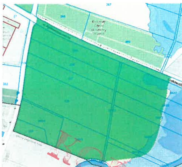
Zagrożenie powodziowe na obszarze objętym przystąpieniem do opracowania planu miejscowego