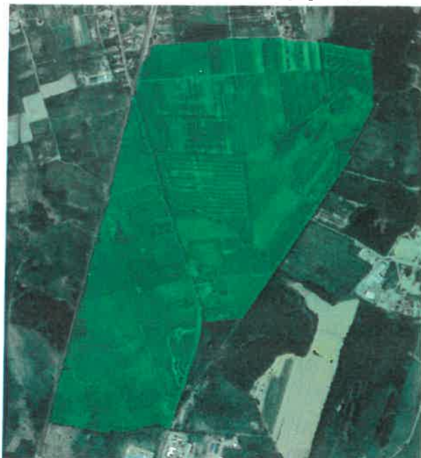
Ortofotomapa obszaru objętego uchwałą o przystąpieniu do sporządzenia planu miejscowego ( https://mapy.legnica.eu/ )

Obszar objęty opracowaniem planistycznym zajmuje powierzchnię 151,64 ha i położony jest w północnej części Legnicy, w sąsiedztwie ul. Poznańskiej i Rzeszotarskiej, przy granicy z Gminą Miłkowice. Jest to teren w przewadze niezainwestowany wykorzystywany jako tereny rolnicze. Oprócz tego jest na nim zlokalizowane m.in. kilkanaście budynków mieszkalnych oraz stacja paliw.